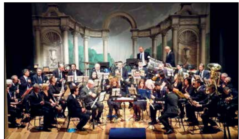
Concerto della Banda al Teatro Bonoris.