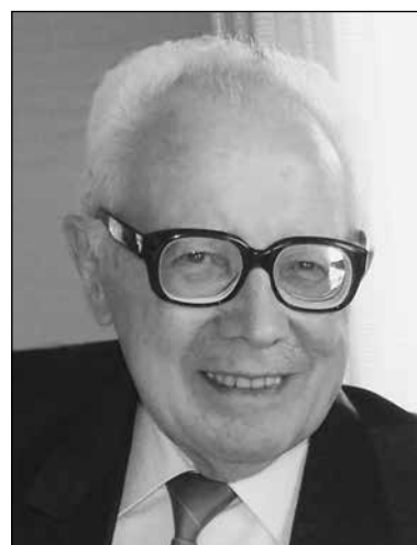
Afro Spazzini 2° anniversario