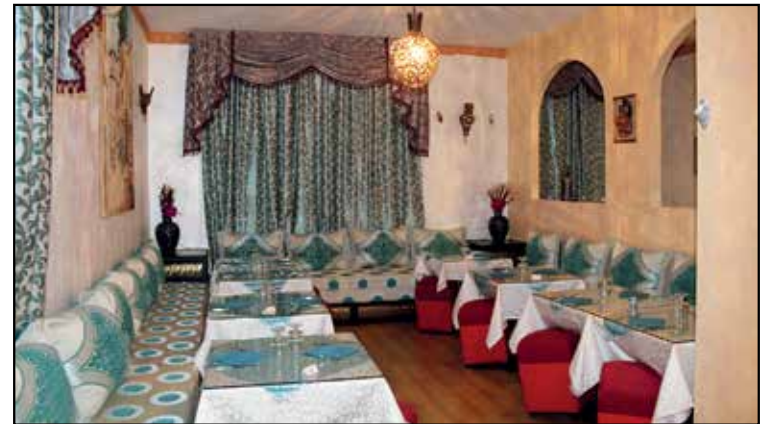
LE DUE SALE ACCOGLIENTI

MENU' ALLA CARTA PIATTI DELLA CUCINA SIRIANA VINO BIANCO-ROSSO-BIRRA-GRAPPA SIRIANI