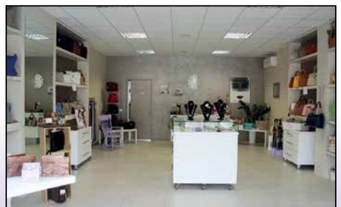
Il negozio di Madame Coco a Montichiari dopo la Farmacia Comunale.

Chiuso il lunedì Via Mons. V.G. Moreni, 83 - Montichiari (BS) - Tel. 030.962205