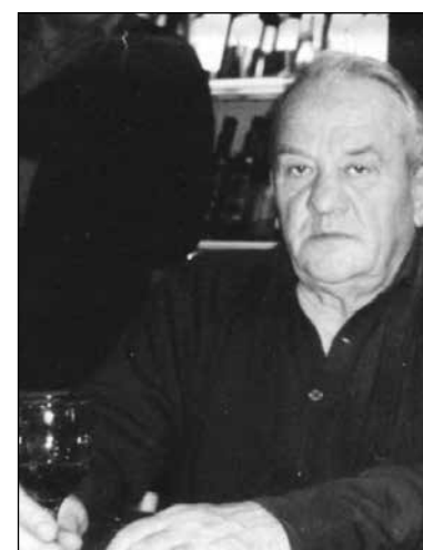
Conzadori (Cicetti) 6° anniversario