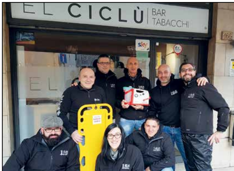
Gli amici del compianto Puddu alla partenza per Brescia.

curato il personale medico, sono aiuti importanti per gli interventi sui bambini, considerata anche la mancanza di disponibilità per reperire le attrezzature. Quindi con la gioia nel cuore vogliamo ringraziare ancora tutti quelli che hanno collaborato e partecipato perché anche quest'anno, dopo le carrozzine donate lo scorso anno, sia stato possibile un altro aiuto importante per i reparti pediatrici degli Spedali Civili di Brescia.