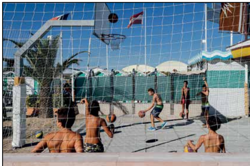
Riccione: ragazzi alle prese con il gioco del basket.